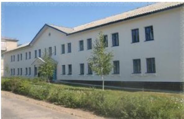
Современный вид здания СДЮТиЭ по ул. Кирова 6

В 1995 году городской отдел народного образования выделяет Станции двухэтажное здание по улице Кирова, дом № 6. После капитального ремонта на 1-м этаже были открыты комнаты для размещения туристских и экскурсионных групп, на 2-м этаже – учебные и административные кабинеты.