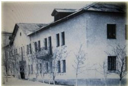
Здание станции туристов по ул.Кирова 6 в 1994 году

Еще совсем недавно слово «турист» в городе Камышине воспринималось как нечто экзотичное: это где-то там, в крупных городах, жили настоящие туристы, поднимающиеся в горы, плавающие на байдарках, совершающие лыжные переходы, отправляющиеся на отдых в другие города и страны. Но оказалось, что вольный ветер приключений всегда манил камышинских девчонок и мальчишек.